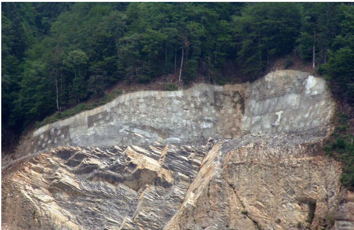
Figure 3: dernière terrasse, paroi avec clouages, effondrement, et dièdre instable.