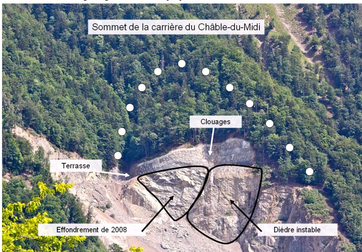
Figure 1: Dernière terrasse, paroi avec clouages, effondrement, et dièdre instable.